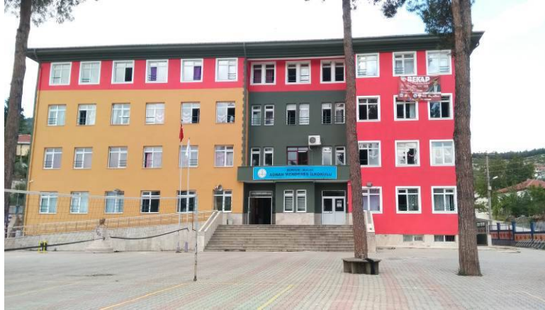
Okulumuz Yeni Binası Dışarıdan Görünümü

Alaaddin Mahallesi; ilçemizin ilk çekirdek kuruluşu oldu. Karye olarak Girmiyeye bağlandı.